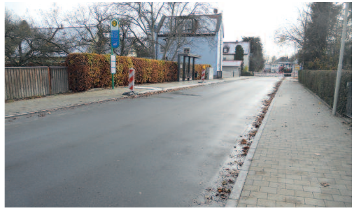
Bildunterschrift: In acht Bauphasen wurde die Ortsdurchfahrt Wartenberg umgebaut.

Das Staatliche Bauamt Freising wünscht gute Fahrt und bedankt sich bei den ausführenden Firmen für die Zusammenarbeit sowie bei allen Bürgerinnen und Bürgern für ihr Verständnis und ihre Geduld während der Bauzeit.