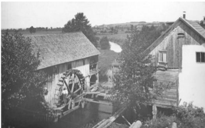
Mühle an der Strogen, Blick Richtung Wartenberg, um 1900, Martin Bösl

Diese kleine Ausstellung ist eine Aktion der Fotofreunde Wartenberg und des OnlineMuseums Wartenberg i.A. der Teams C. Schnürer-Patschan