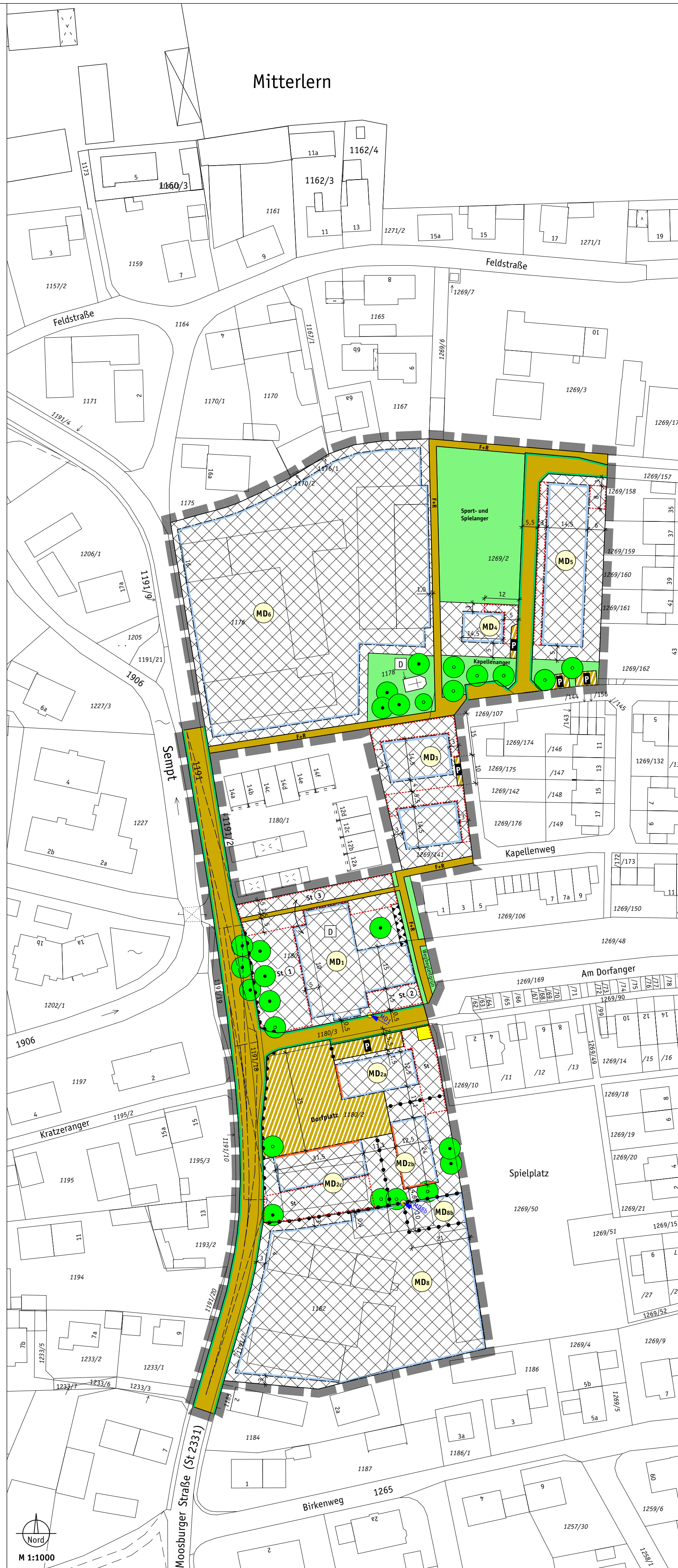
North arrow and scale: Nord, M 1:1000

1) Die Nummer entspricht der Nummerierung in der Anlage zur Stellplatzsatzung 2) Bei der Stellplatzermittlung für Freischankflächen von Gaststätten wird von einer Wechselnutzung ausgegangen. Für Freischankflächen sind nur Stellplätze nachzuweisen, die den Stellplatzbedarf der Gaststätte nach Nr. 4.1 übersteigen. 3) Ein Serviced Apartment ist ein voll möbliertes Apartment, das für verschiedene Zeiträume buchbar ist. Stellplätze von Serviced Apartments sind als Gemeinschaftsstellplätze anzulegen und dürfen nicht einzelnen Apartments fest zugeordnet werden.